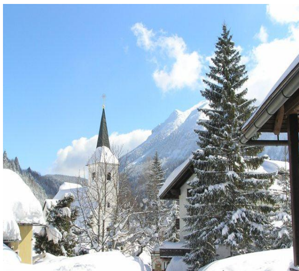
Szállás Sporthotel, Lackenhof Pályaszállás, ülőszékes felvonótól 100m-re

2012. március 15-18. csütörtöktől vasárnapig Lőrinc Kupa Síverseny márc. 17-én